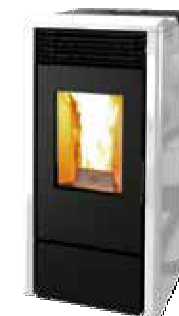
Bianco - White Blanc - Blanco Λευκό - Weiß Белила