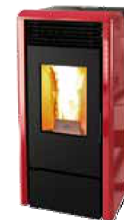
Rosso - Red Rouge - Rojo Κόκκινο - Bordeaux Красный