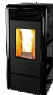
Nero - Black Noir - Negro Schwarz - Μαύρο черный