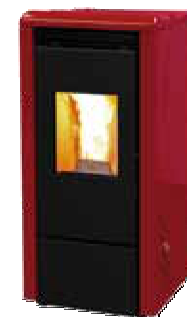
Rosso - Red Rouge - Rojo Κόκκινο - Bordeaux Красный