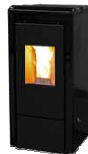
Nero - Black Noir - Negro Schwarz - Μαύρο черный