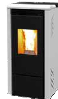
Bianco - White Blanc - Blanco Λευκό - Weiß белая