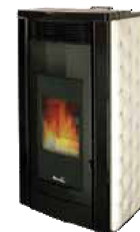
Bianco - White Blanc - Blanco Λευκό - Weiß Белила