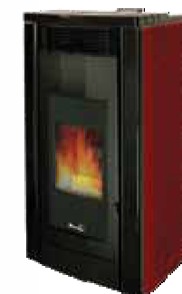
Rosso - Red Rouge - Rojo Κόκκινο - Bordeaux Красный