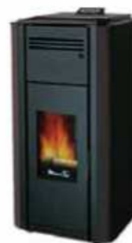
Nero - Black Noir - Negro Schwarz - Μαύρο черныйхх