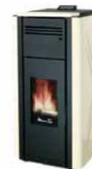
Bianco - White Blanc - Blanco Λευκό - Weiß белита