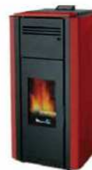
Rosso - Red Rouge - Rojo Κόκκινο - Bordeaux Красный