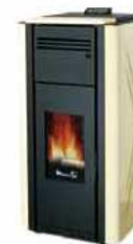
Pergamena - Ivory Ivoire - Marfil Ιβουάρ - Elfenbein слоновой кости