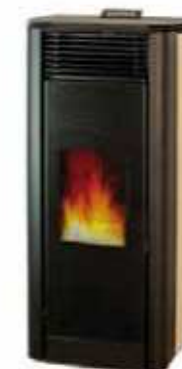
Pergamena - Ivory Ivoire - Marfil Ιβουάρ - Elfenbein слоновой кости