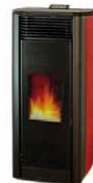
Rosso - Red Rouge - Rojo Κόκκινο - Bordeaux Красный