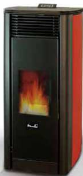
Basic model MFAR18SRD

RU Приятная и теплая, термочепец а pellets Artemide, украшенный изысканной майоликой, выполненной полностью вручную. Мощность в 18 kW делают ее идеальным выбором для помещений средних и больших размеров.